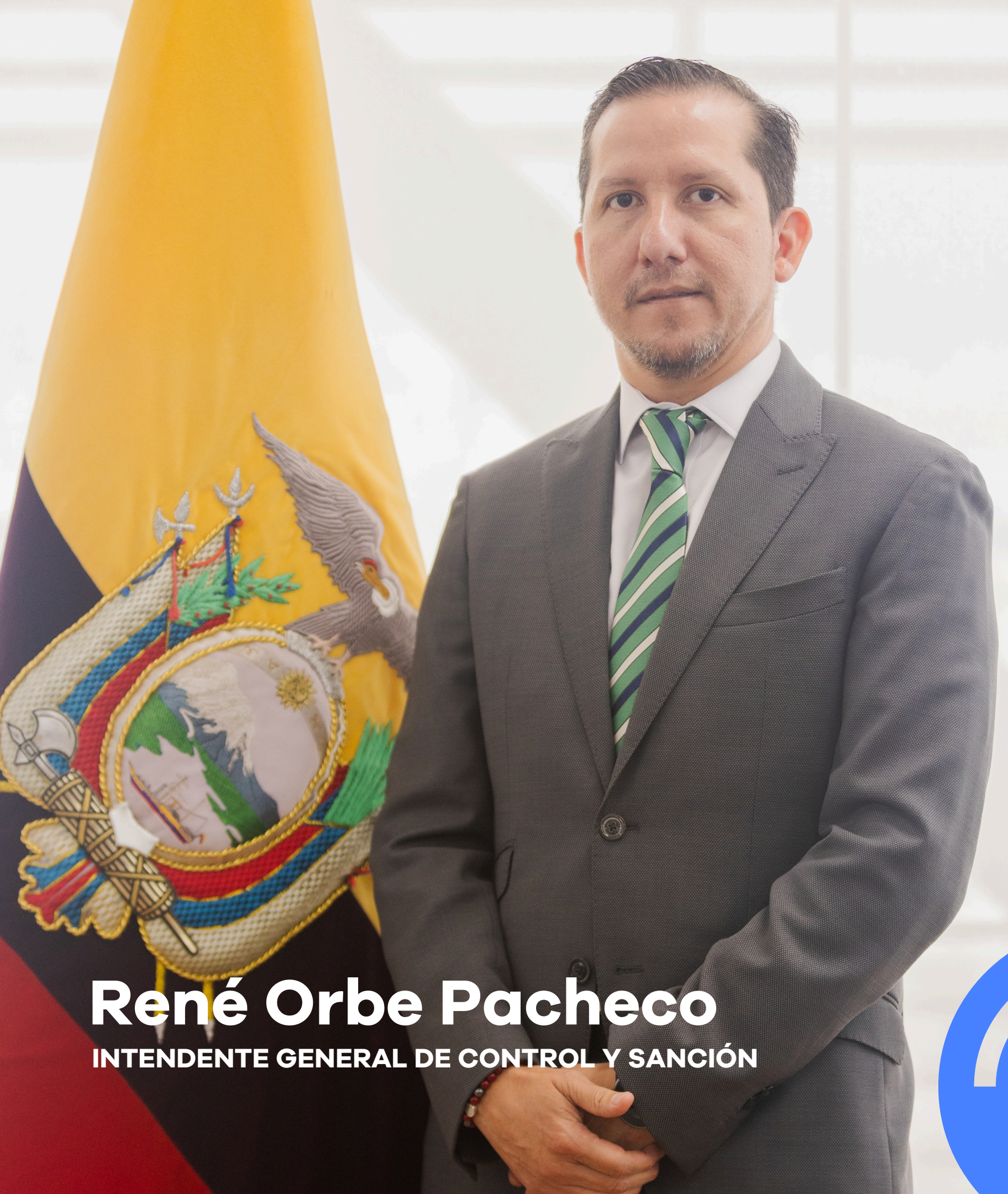
René Orbe Pacheco INTENDENTE GENERAL DE CONTROL Y SANCIÓN