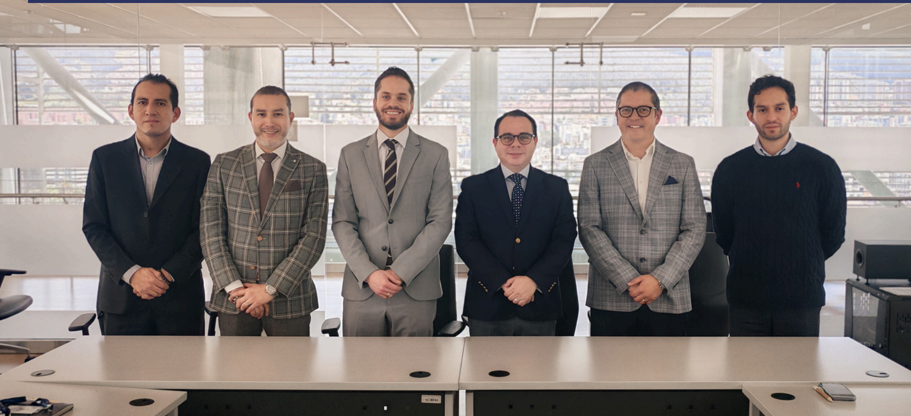
Agencia de Regulación y Control de Hidrocarburos