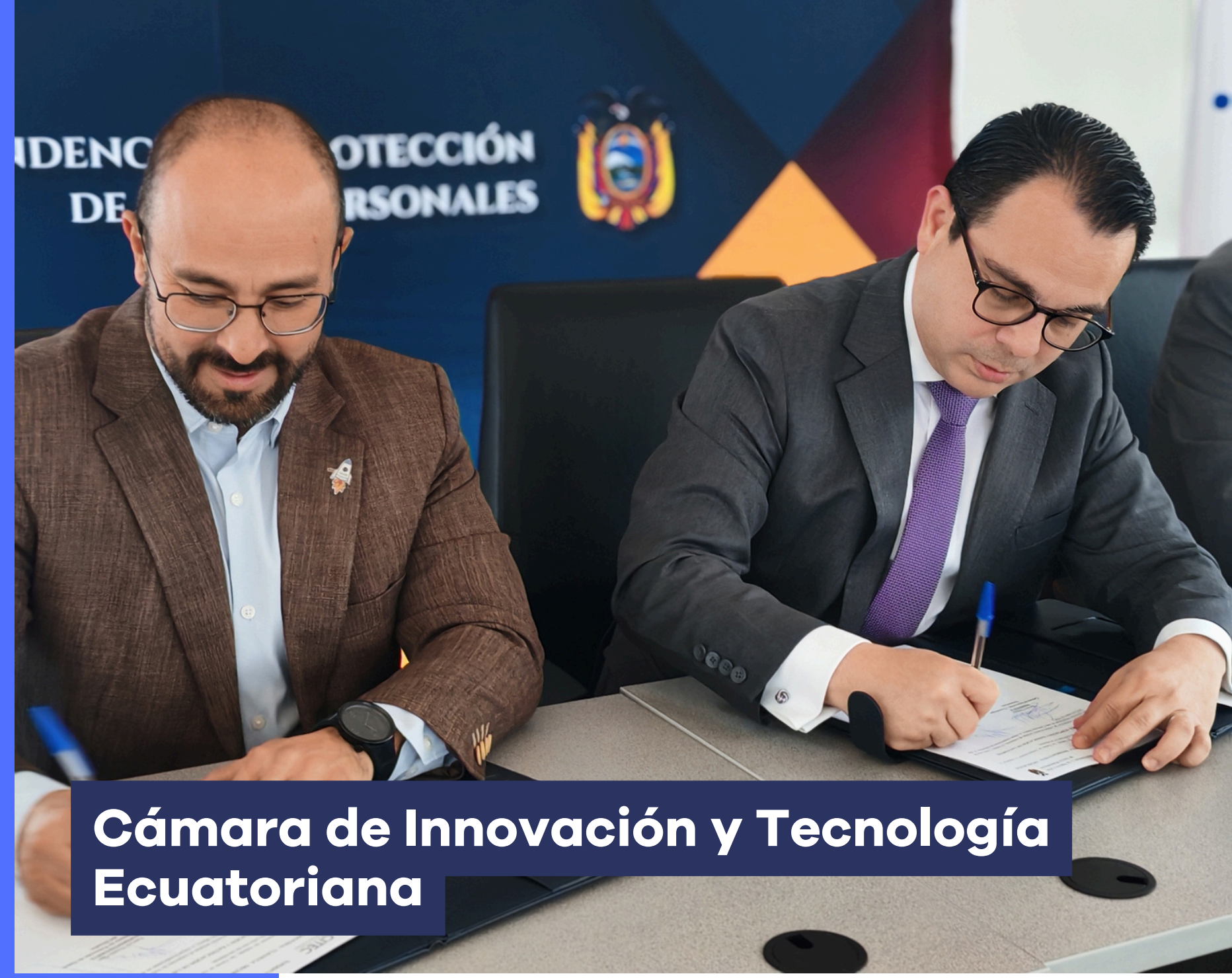
Cámara de Innovación y Tecnología Ecuatoriana