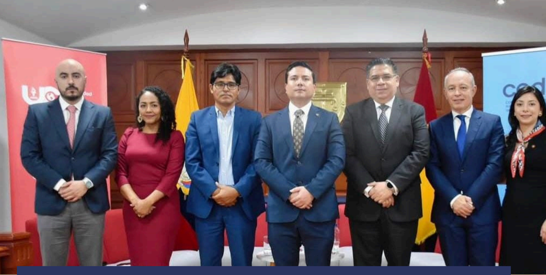
Corporación Ecuatoriana para el Desarrollo de la Investigación y la Academia