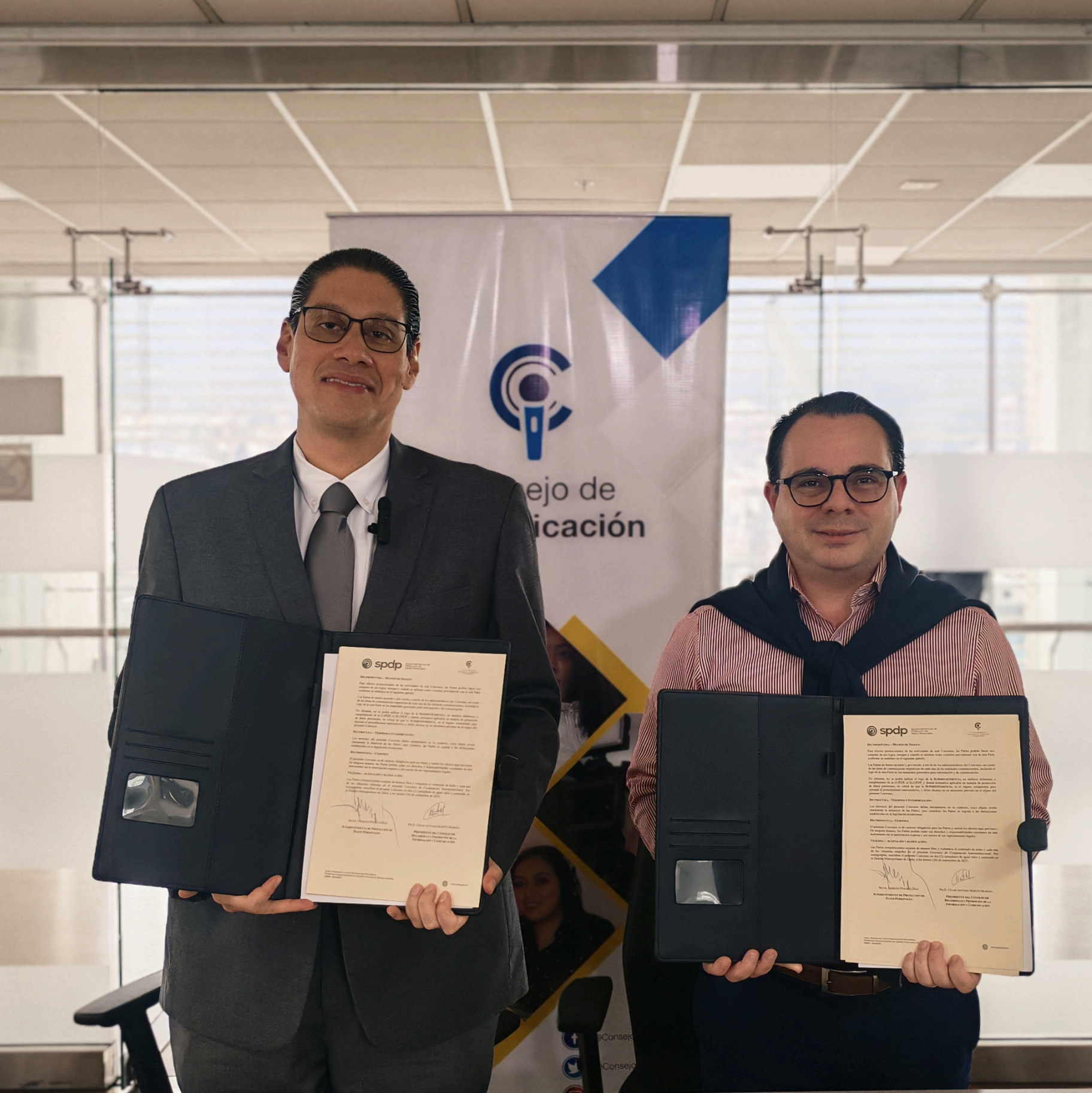
Consejo de Comunicación